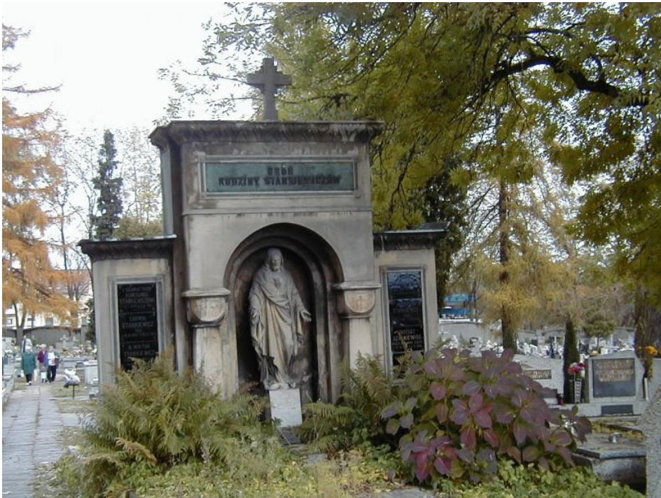
Cmentarz Parafialny w Oświęcimiu