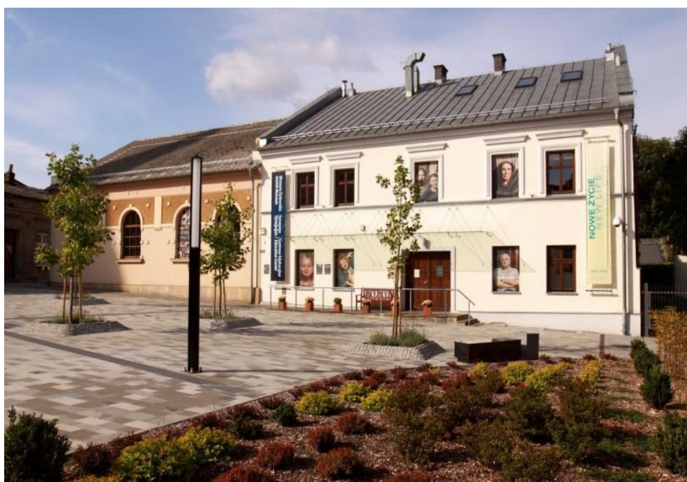
Muzeum Żydowskie Synagoga