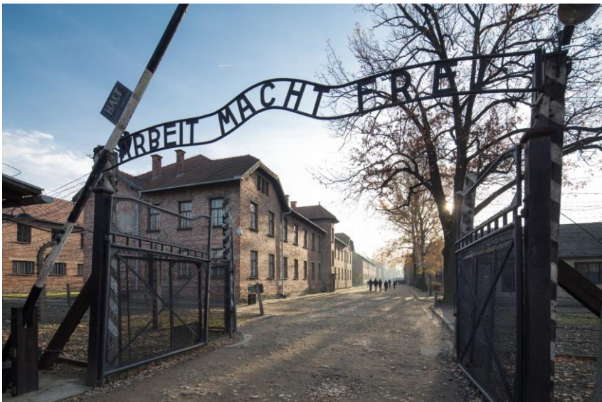
Miejsce Pamięci i Muzeum Auschwitz-Birkenau