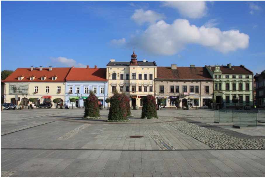
Rynek – kamienica Ślebarskich