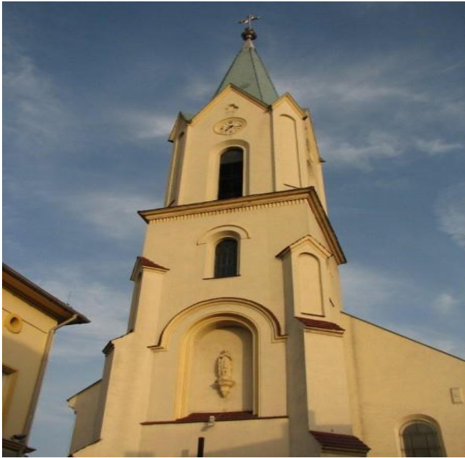
Kościół pw. Wniebowzięcia Najświętszej Marii Panny