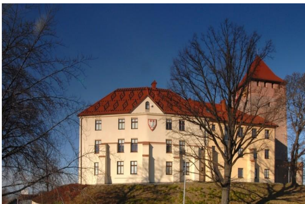
Muzeum Zamek w Oświęcimiu